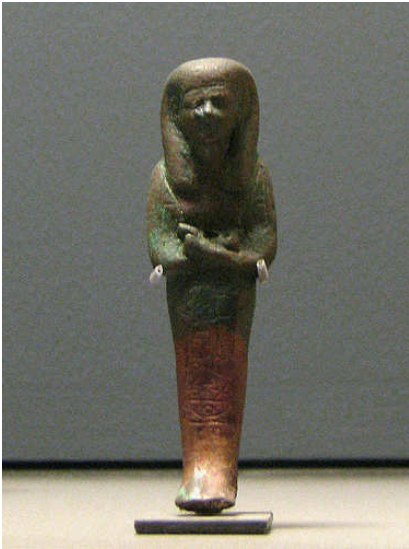
Fig. 9 – Ushabti di Psusennes I.

una fascia legata dietro la testa, comparsa per la prima volta con Masaharté 37 .