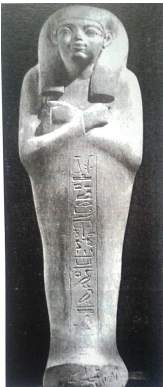
Fig. 1 – Statuette funeraria di Akhemnechet.

Nell'esemplare di Maya si nota un particolare affetto verso il suo sovrano oltre al rispetto, ma non è l'amore che lo spinse a dedicare l'ushabti al suo signore. Si crede, infatti, che fu spinto dalla volontà di ottenere un posto privilegiato nell'Aldilà e la donazione della statuette funeraria serviva per avere l'approvazione del Re, nonostante questa azione sia religiosamente inaccettabile perché profana la privilegiata posizione di Tutankhamon nell'altra vita 16 .