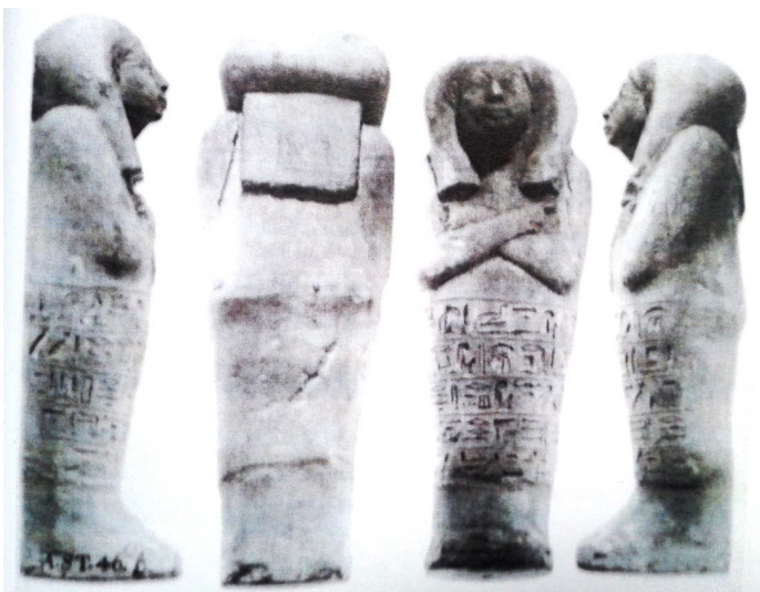
Fig. 3 - Ushabti di Ahmosis.

Con il Nuovo Regno l'Egitto è all'apice del suo splendore, principalmente per le conquiste di Tuthmosis III grazie al quale il regno si estendeva dall'Eufrate a Napata, in Sudan 22 , oltre alla pace perseguita da Amenhotep III. Questo benessere è ben visibile negli ushabti, fabbricati in materiale diverso, preludio dell'eterogeneità che sarà maggiormente presente nei decenni successivi, soprattutto con Tutankhamon di cui conosciamo numerosi ushabti, uno differente dall'altro, con materiali pregiati che tradiscono la ricchezza dell'epoca. Qualche statuetta rimane ancora senza mani visibili, ma durante la XVIII dinastia generalmente si abbandona l'aspetto mummiforme, sostituito dagli abiti dei viventi, lussuosi e pieghettati, i piedi adornati da sandaletti e talvolta compare un pilastrino dorsale, simbolo del dio creatore eliopolitano Osiride-Ra 23 . Anche le iscrizioni subiscono un mutamento, infatti, la formula d'offerta a Osiride, in modo che il Ka sia fornito di tutti gli alimenti, cede il passo al Capitolo VI del Libro dei Morti e si aggiunge un nuovo passaggio: