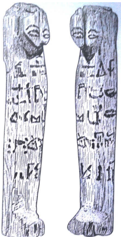
Fig. 2 - "Teste di Legno".

l'importanza del dio Osiride, signore dell'Oltretomba evidente nelle prime statuette funerarie del Medio Regno che richiamano le sembianze del dio: erano in pietra o in legno con il corpo mummiforme e solo la testa libera dall'involucro 18 . Le statuette del Medio Regno possono essere suddivise in due categorie: statuette senza mani visibili interamente anepigrafi o decorate con un testo e statuette con le mani in rilievo, incrociate sul petto che richiama la grande statuarica contemporanea, come l'ushabti datato alla XIII dinastia appartenente a una donna, Akhemnechet, "Splendente nella barca Nechet" (Fig. 1), ossia la barca sacra del tempio di Abido sulla quale naviga il dio Osiride 19 .