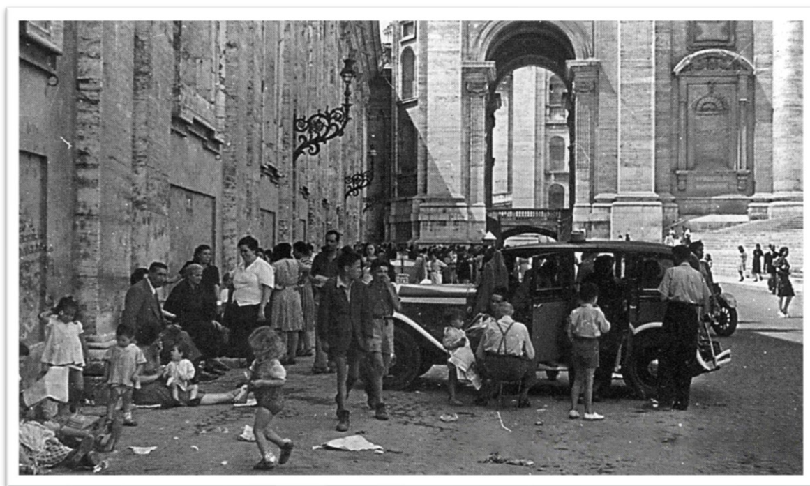
Sfollati a piazza San Pietro nel 1944.