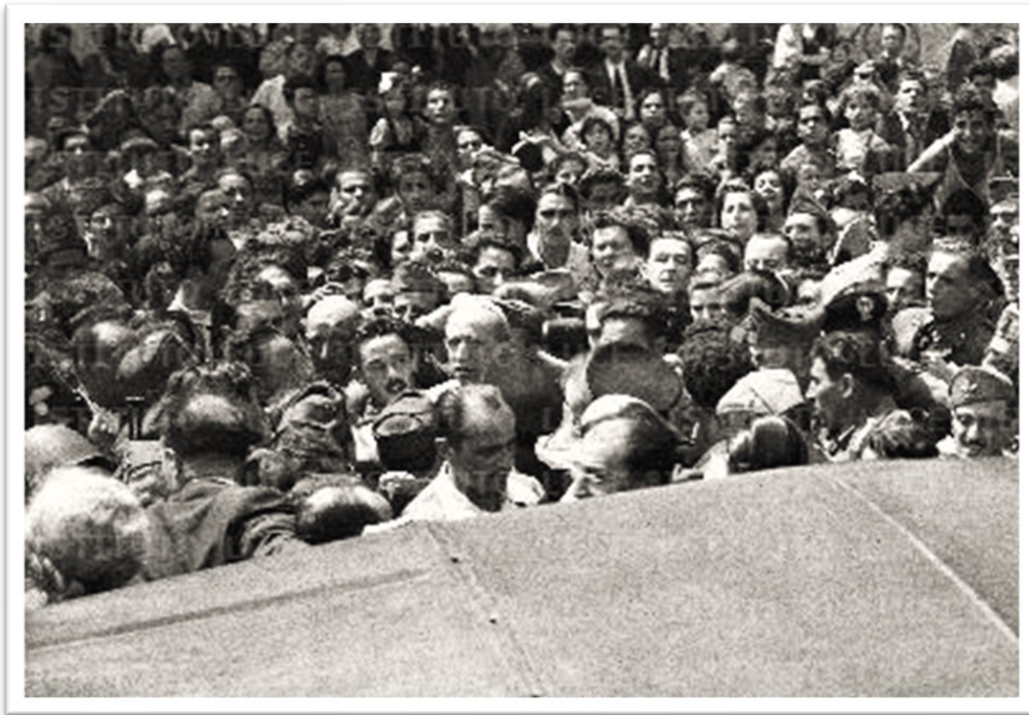
Pio XII circondato dalla popolazione del quartiere San Giovanni-Appio dopo il bombardamento del 13 agosto 1943.

Stavo celebrando un matrimonio tra sfollati a porte chiuse, uscimmo perché sentimmo i bombardamenti e vidi il fumo verso piazza Tuscolo. Presi l'olio degli infermi e alcune particole e mi avvicinai alla zona. Mentre ero lì, venne sganciata una nuova bomba, mi salvai per miracolo.