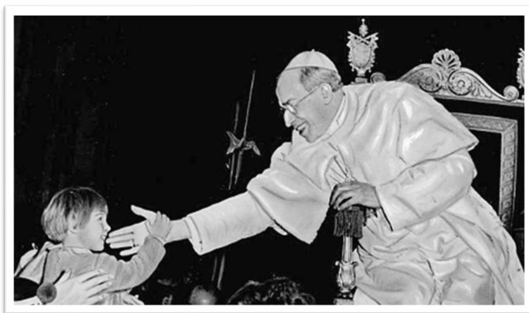
Pio XII, sorridente, accarezza un bambino in una cerimonia a San Pietro

Nel 1958, muore praticamente senza soldi; quelli che aveva erano stati già distribuiti ai poveri che ne facevano richiesta - come quando prese tutti i soldi in cassaforte per portarli a San Lorenzo, a Roma, nelle ore successive al bombardamento. 22