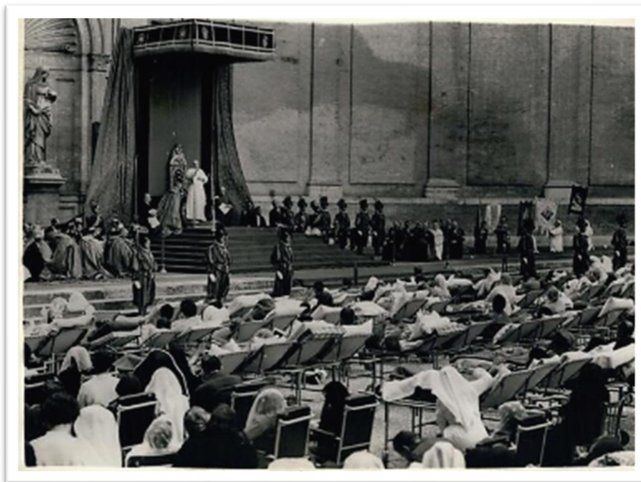
9 ottobre 1957. Pio XII parla a un considerevole numero di malati.

utilizzate fossero attendibili: era in questo molto scrupoloso. Amava ringraziare di persona per i libri che gli avevo potuto procurare. Più di una volta ho cercato di inginocchiarmi a ogni udienza privata, come si usava allora, e lui tutte le volte me lo ha impedito: gli bastava un normale saluto. Come mi colpiva che ogni volta, terminato il colloquio, mi volesse accompagnare fino alla porta del suo studio in Vaticano. Era un uomo che vedeva tutto alla luce della fede e dell'eternità. (Intervista di Filippo Rizzi a Padre Gumpel SI, 2013). 19