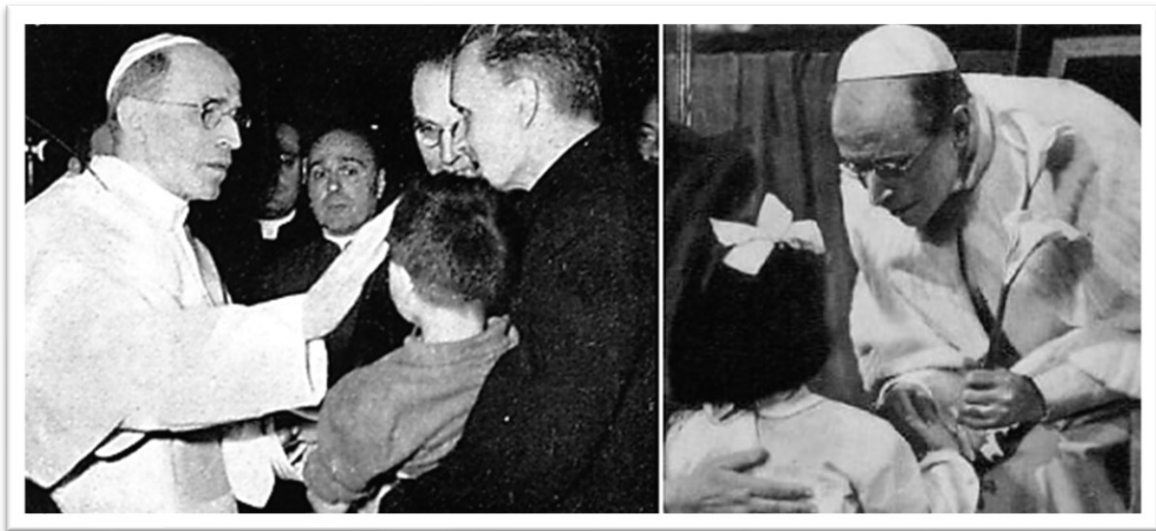
A sinistra: Don Carlo Gnocchi (Beato) presenta a Pio XII uno dei suoi "mutilatini" (1950).

Nel migrare del tempo, la figura e l'opera di Pio XII 1 ( Venerabile ) è stata presentata in diversi modi. Evidentemente, un'attenzione particolare è stata rivolta alle sue virtù. Unitamente a ciò, conservano un particolare valore il suo magistero, i discorsi, i radiomessaggi, le esortazioni, le encicliche, le proclamazioni dogmatiche. Si tratta di una vasta eredità, rafforzata dalle opere di carità, che il Concilio Vaticano II e i Papi successivi sapranno accogliere e valorizzare. Accanto agli aspetti cit. , la storia consegna anche un Papa "privato", un Pacelli capace di "uscire" dagli schemi del tempo, e di manifestare in modo aperto il proprio animus . Tale realtà si riscontra, in particolare, nelle situazioni riguardanti anche i piccoli, i deboli, gli emarginati e gli umili.