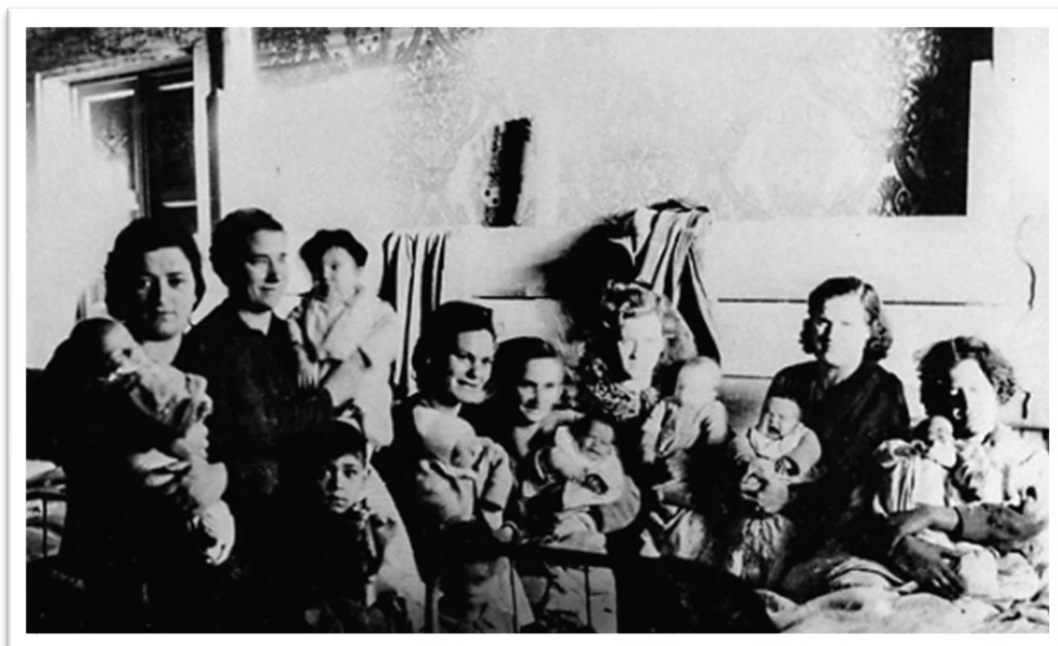
1943. Alcune mamme con i loro neonati accolte nel palazzo pontificio di Castelgandolfo.