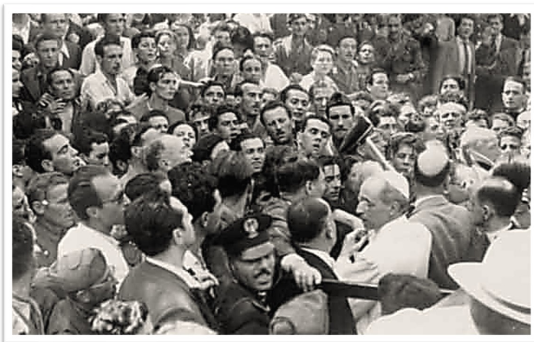
Pio XII circondato dalla popolazione del quartiere San Giovanni-Appio dopo il bombardamento del 13 agosto 1943.

( Benedetta Capelli, Bombardamento di Roma e Pio XII [13 agosto 1943] ). 16