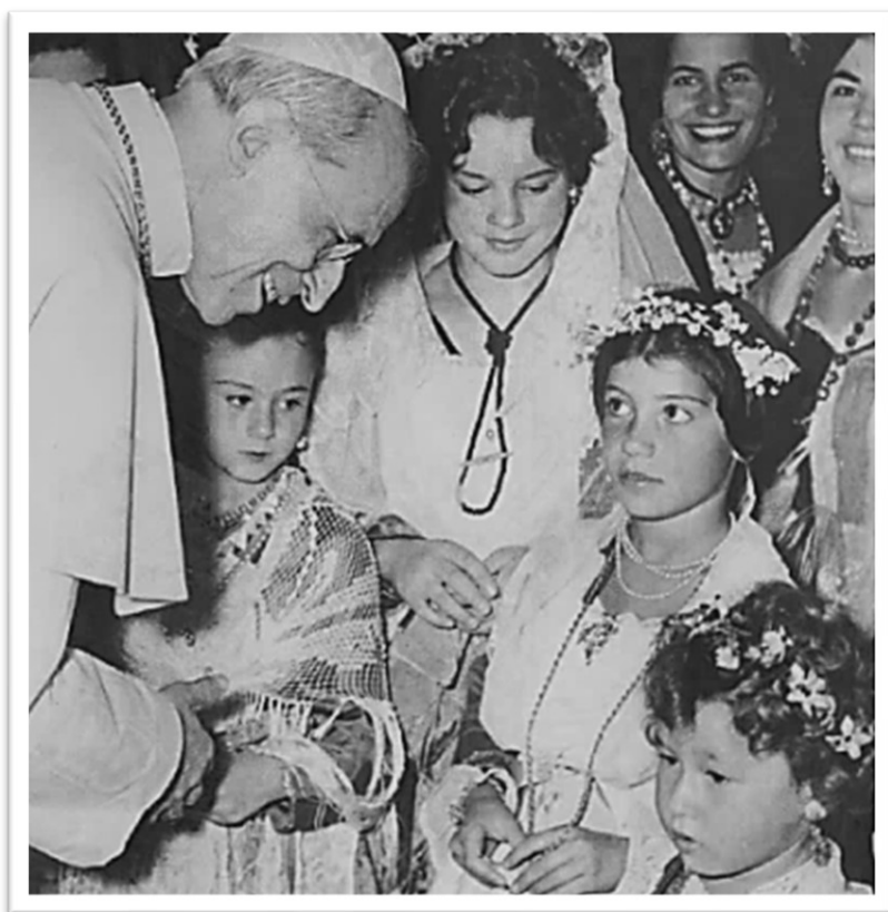
Pio XII, durante un'udienza, si ferma a guardare sorridente una bambina