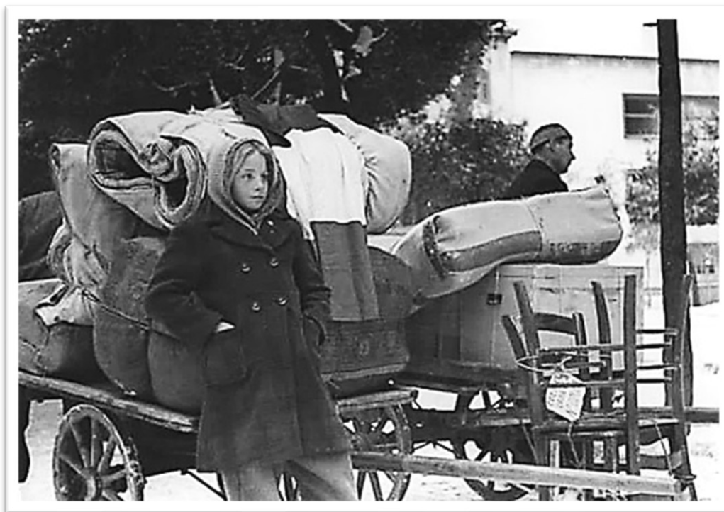
Un'immagine dell'esodo giuliano dalmata fiumano (1943-1956).