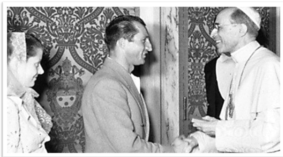
Pio XII riceve in udienza il ciclista Gino Bartali