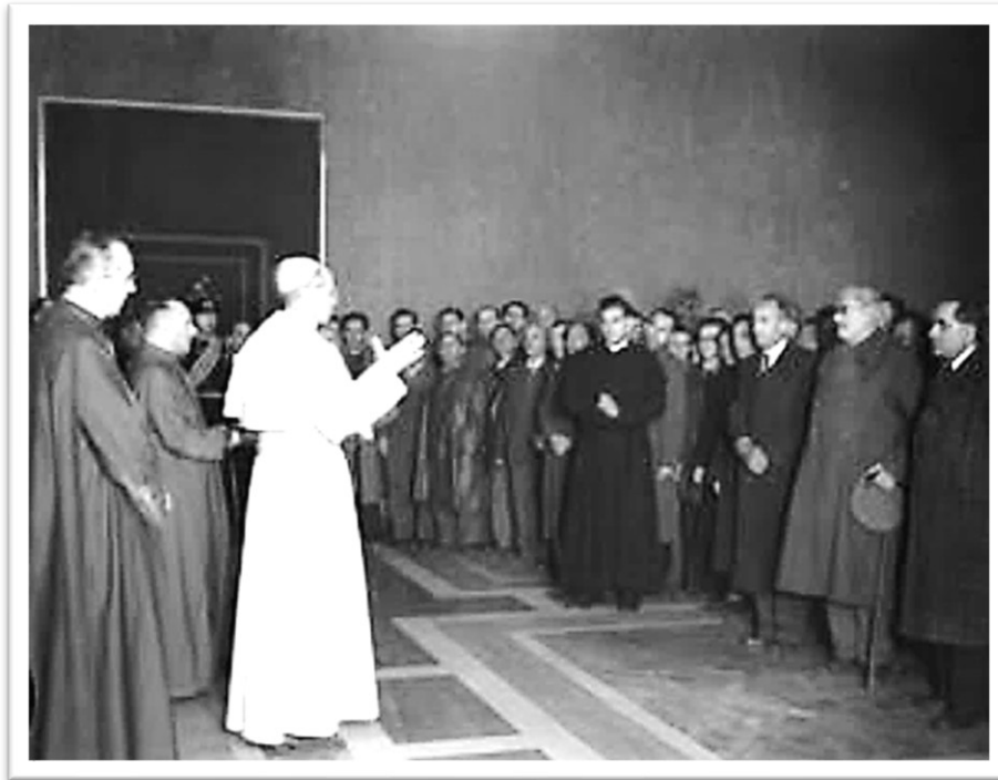
Novembre 1945. Pio XII incontra un gruppo di ebrei scampati alla morte nei lager. Il Papa per quell'incontro abolì ogni formalità e rimase in piedi davanti agli ospiti.