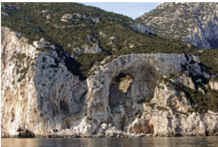
Arco di Ulisse - Tavolara

L'Area Marina Protetta ha predisposto diversi punti informativi dislocati sul territorio per informare e sensibilizzare i visitatori sulle regole esistenti e sul valore ambientale dell'area. Hanno sede a San Teodoro, presso l'I.CI.MAR (Istituto Civiltà del Mare), a Porto San Paolo, presso la Pro Loco, e sull'Isola di Tavolara, presso un proprio Info Point.