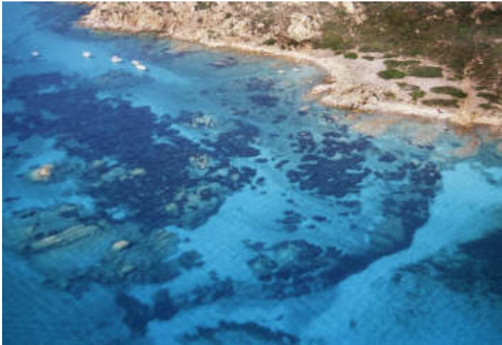
Piscine Molara

La sua gestione dal 2004 è affidata ad un Consorzio costituito fra i Comuni di Olbia, Loiri Porto San Paolo e San Teodoro. Interessa la costa della Sardegna nord-orientale, da Capo Ceraso fino a Cala Finocchio, e comprende le isole principali di Tavolara, Molara e Molarotto. C'è, poi,