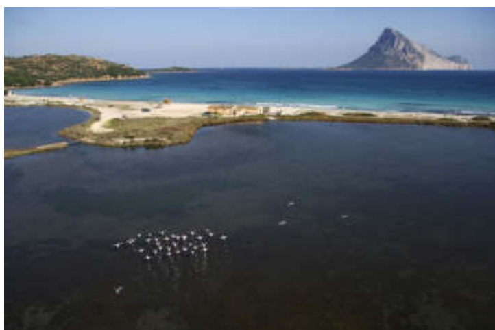
Porto Taverna

In circa 16 anni di gestione siamo riusciti a produrre buoni dati per la conservazione ambientale. Ci siamo concentrati molto anche sul riordino delle attività economiche per tracciare profili di sostenibilità ambientale. Abbiamo varato un regolamento che disciplina tutte le attività consentite dal punto di vista economico all'interno dell'area marina. Questa regolamentazione ha creato un sistema produttivo armonico. Tutti i valori ambientali generano economie che possono essere misurate. Noi abbiamo valorizzato il territorio, la nostra economia genera ricchezza duratura.