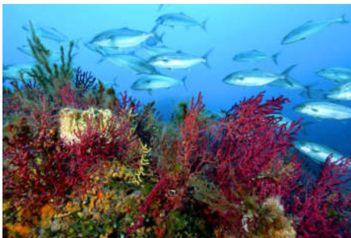
Gorgonia Rossa, Secca del Papa, Isola Tavolara

Le Aree Marine Protette sono riserve dello Stato. Nascono per la tutela della biodiversità, la conservazione della specie, la ricerca scientifica e lo sviluppo economico del territorio.