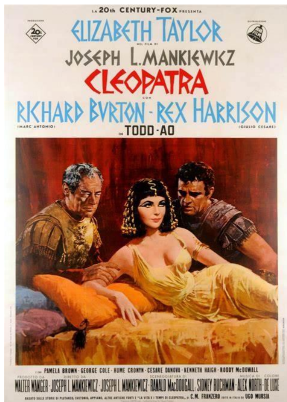
Figura 2: locandina del film Cleopatra (1963)

Il modo in cui ella sembrerebbe aver architettato la sua stessa fine, secondo quel gusto per la teatralità che le viene attribuito da Plutarco, le ha permesso di diventare un mito, come la regina viene descritta nel titolo della grande mostra londinese del 2001 Cleopatra of Egypt: from history to myth , a lei dedicata. Personaggio storico e politico, descritto ai posteri come una personalità ambigua, Cleopatra VII d'Egitto ha ispirato, solamente tra il 1540 e il 1905 ben 127 lavori teatrali – più precisamente 77 drammi, 45 opere liriche e 5 balletti. Per non parlare di compositori del calibro