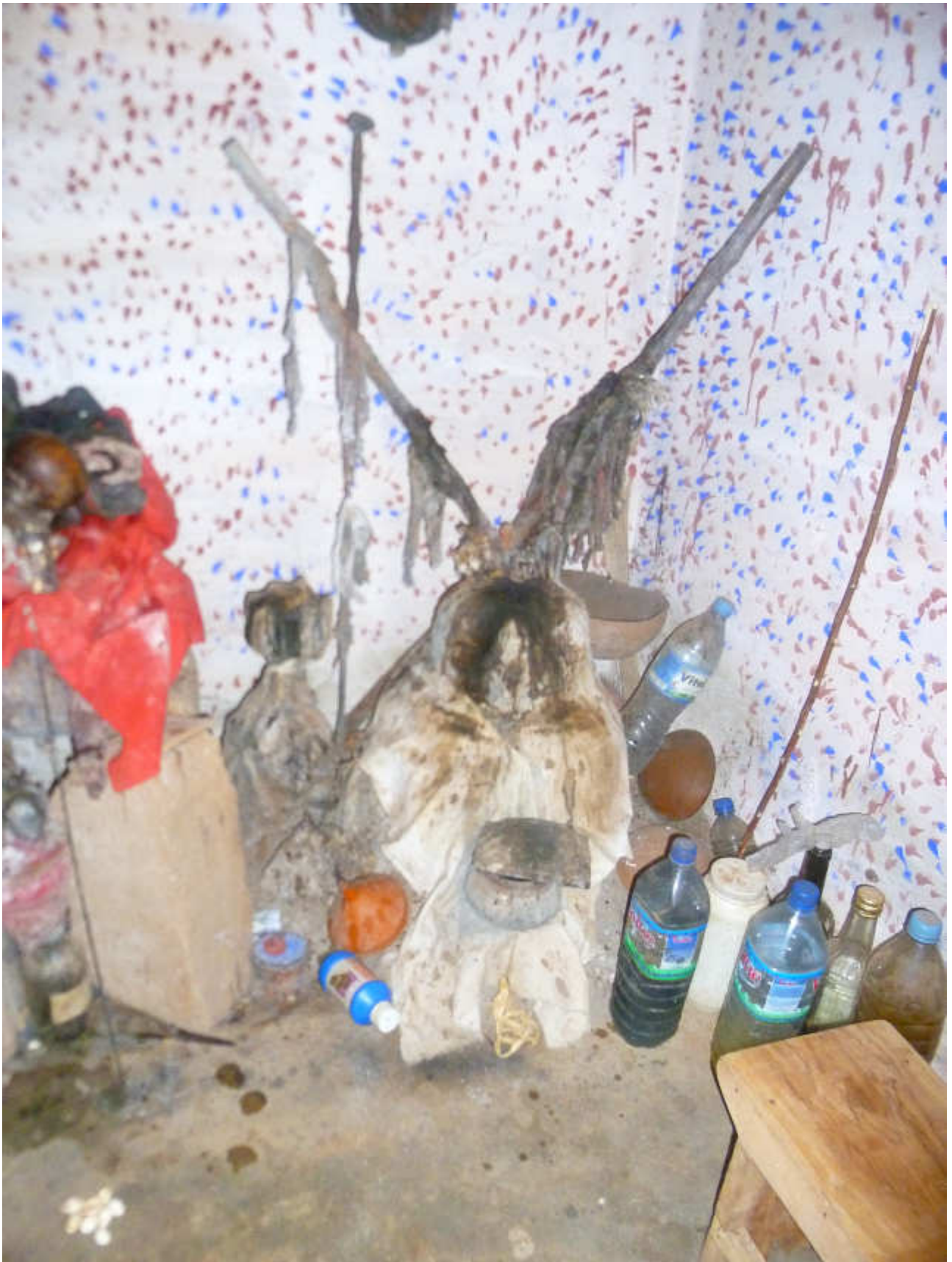
Fig.15-Rappresentazione di un Loa