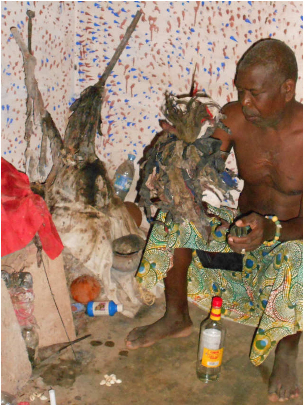
Fig.11-L'Hungan offre una bevanda ad un Loa