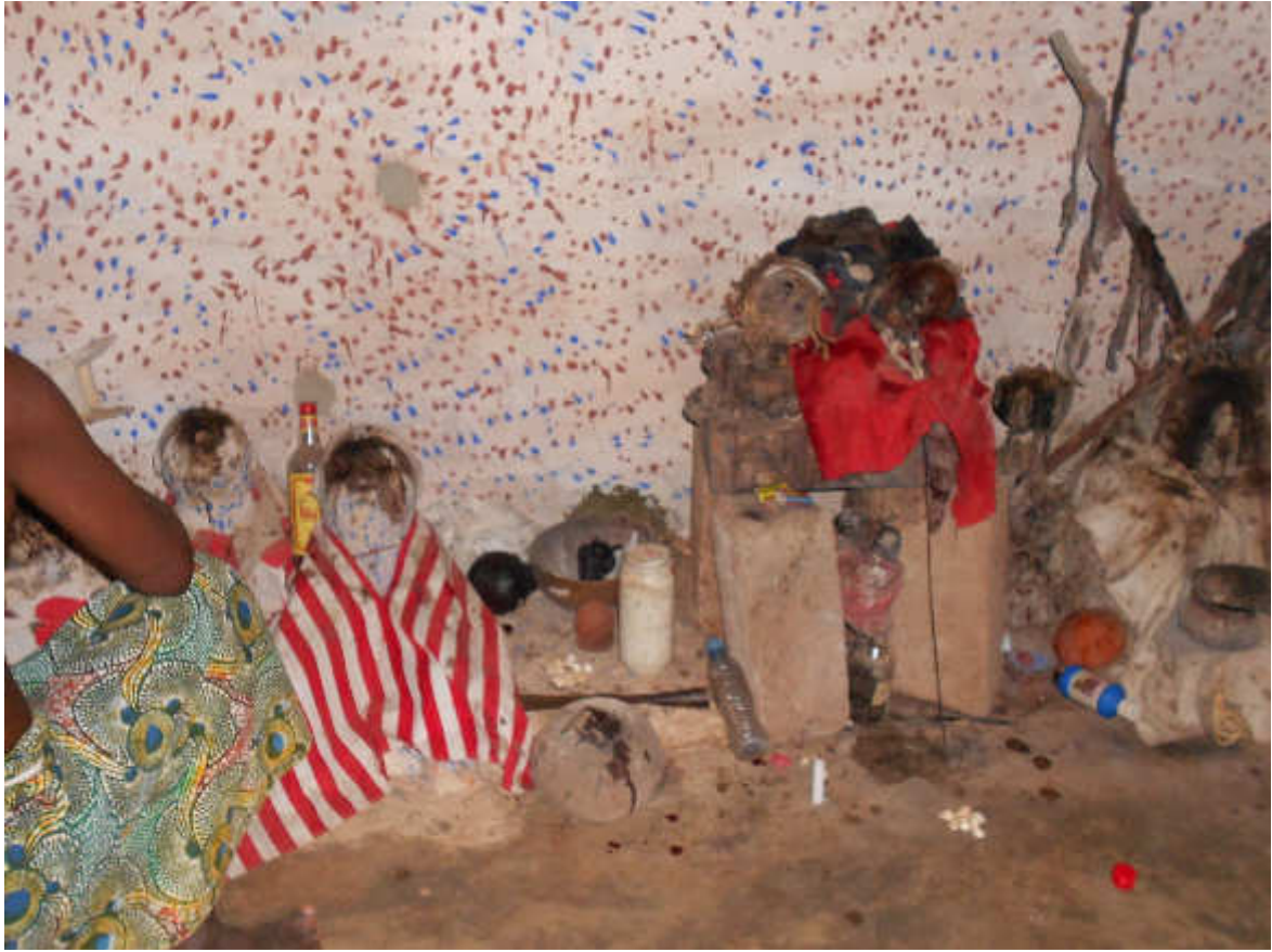
Fig.10-Rappresentazioni di Loa