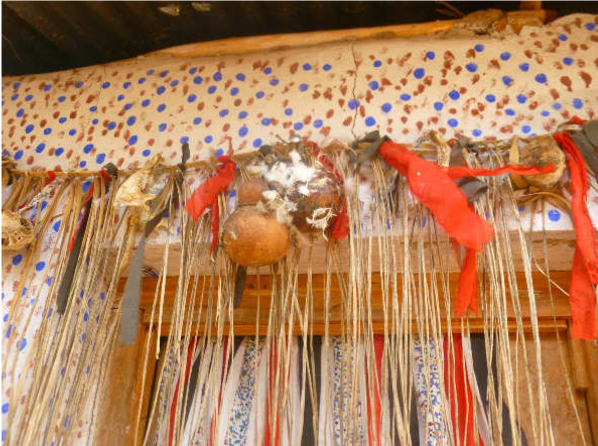
Fig.8-Feticci e gri-gri