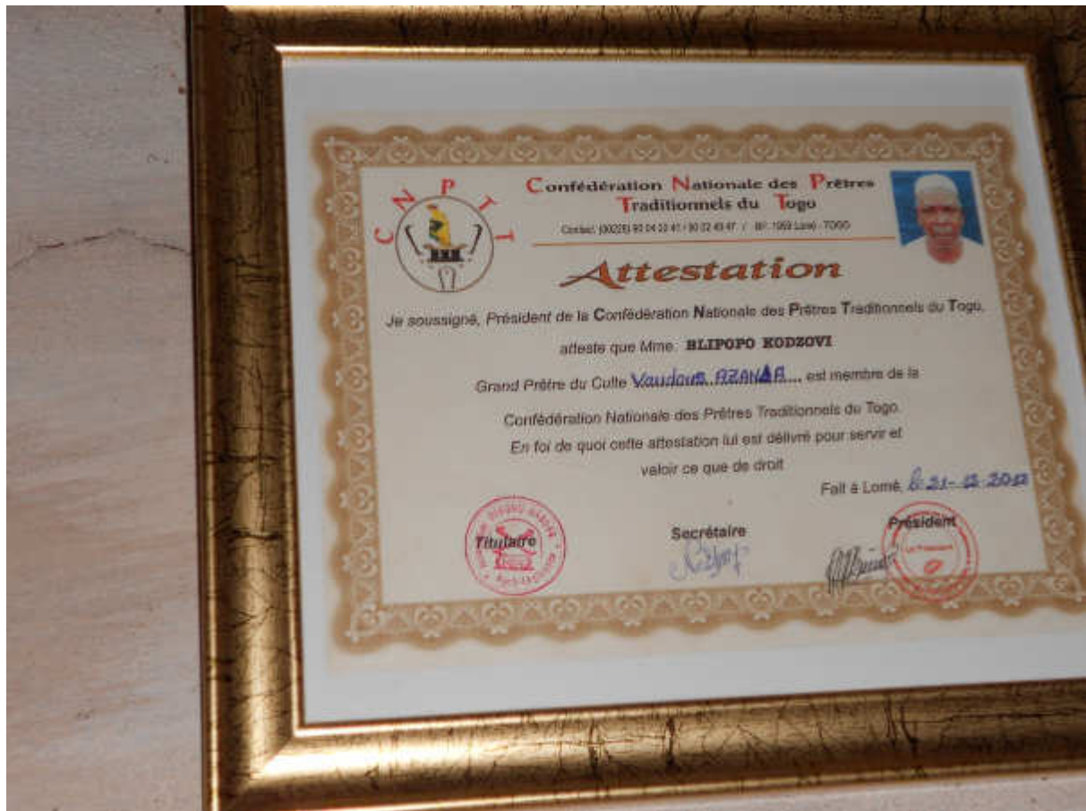
Fig.2- Attestazione di sacerdote del culto Vodou

Nella dimensione individuale della possessione gli adepti ovvero i voduschie possono essere consacrati ad uno o più Loa (spiriti) e attraverso la promessa rituale atamukaka , di compiere sacrifici e di onorare lo spirito in modo continuativo, si crea una alleanza, una sorta di matrimonio che vincola l'adepto alla divinità.