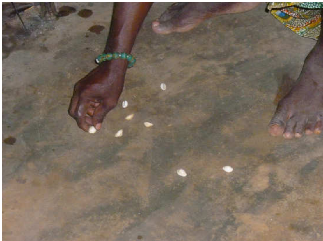
Fig. 5-Interpretazione dei cauri