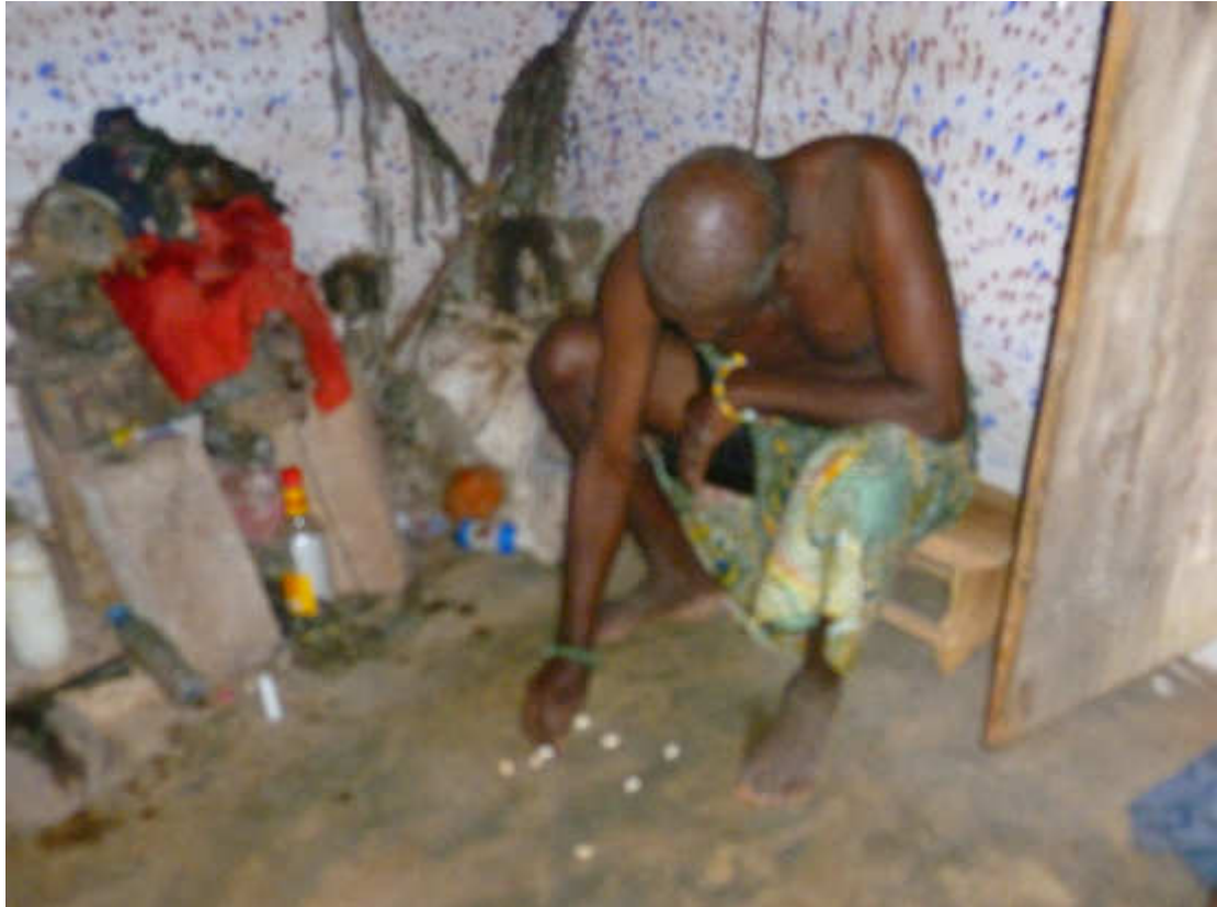
Fig. 4- L'Hungan si appresta ad interpretare i cauri.