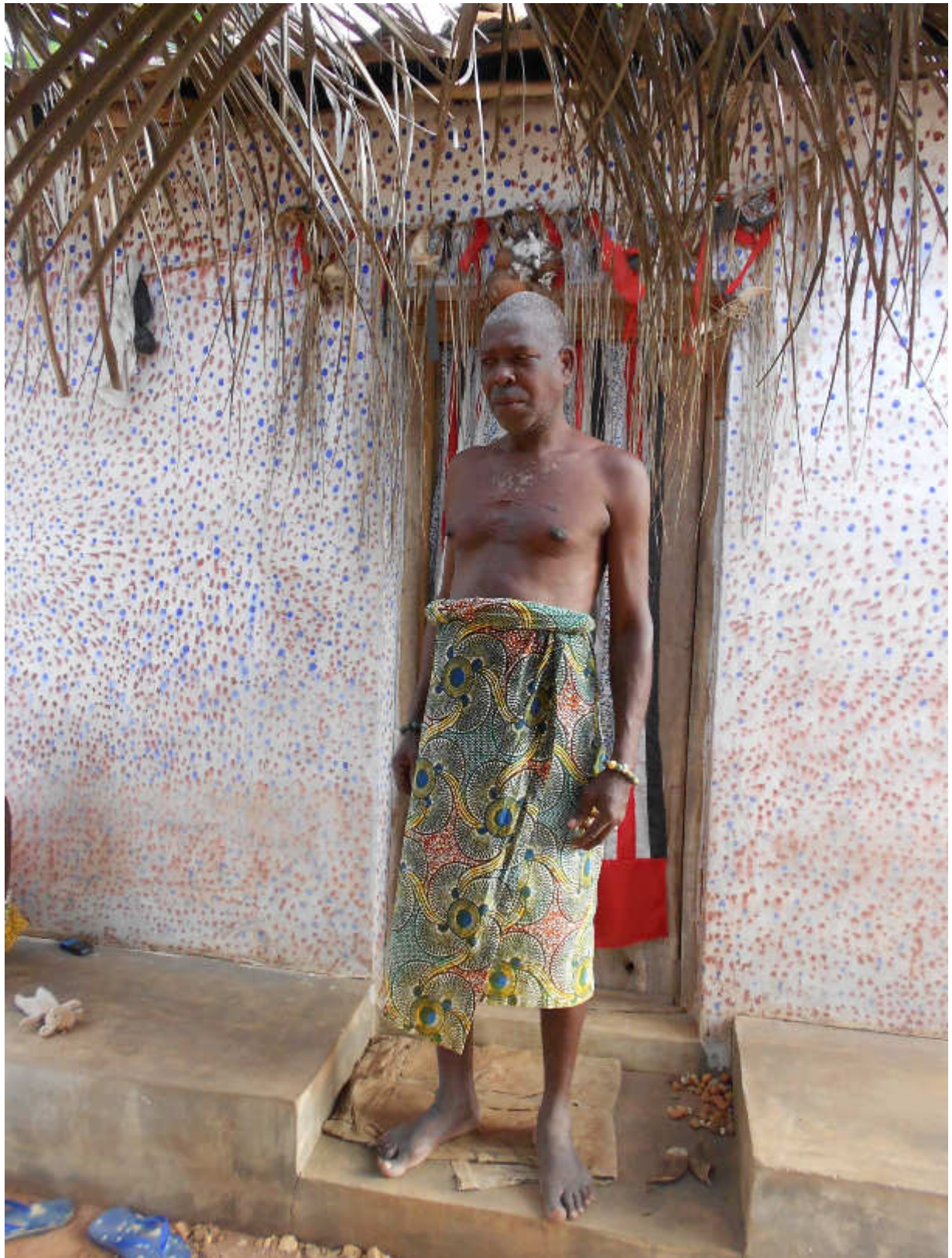
Fig.7-Sacerdote guaritore (Hungan) all'ingresso della casa dei Loa