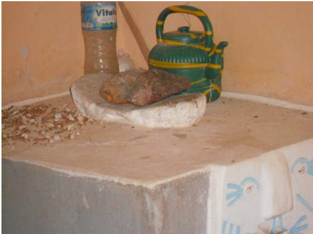
Fig 14-Particolare dell'altare votivo