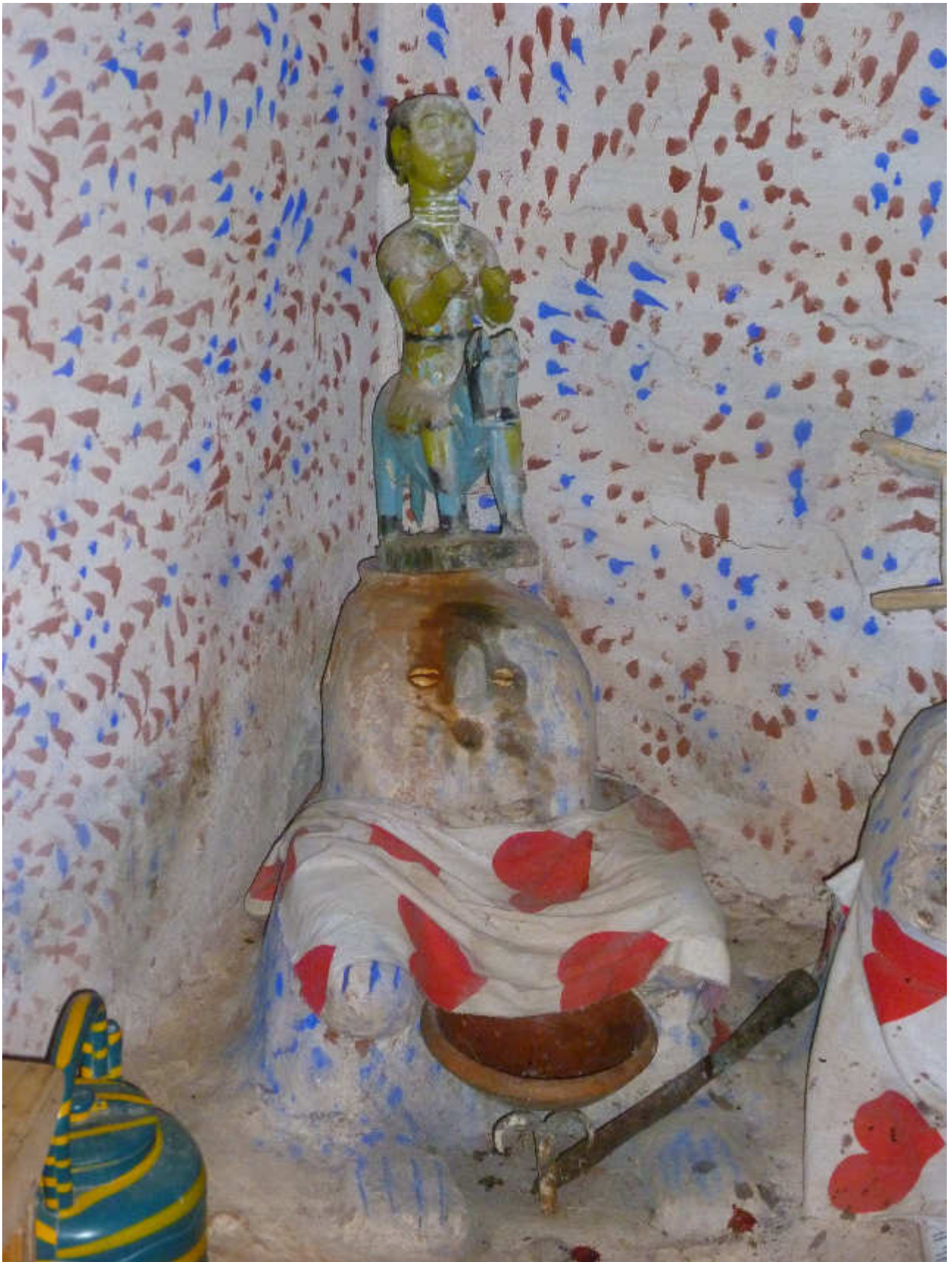
Fig. 16-Presumibile rappresentazione del Loa della guerra, indicato dall'arma da taglio e dal gancio in ferro.