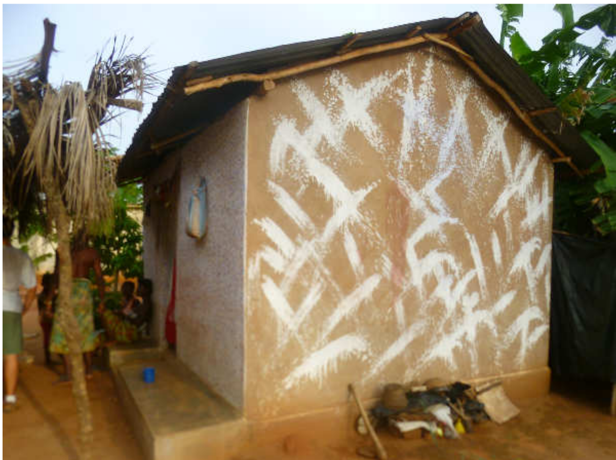
Fig. 6-La casa dei Loa