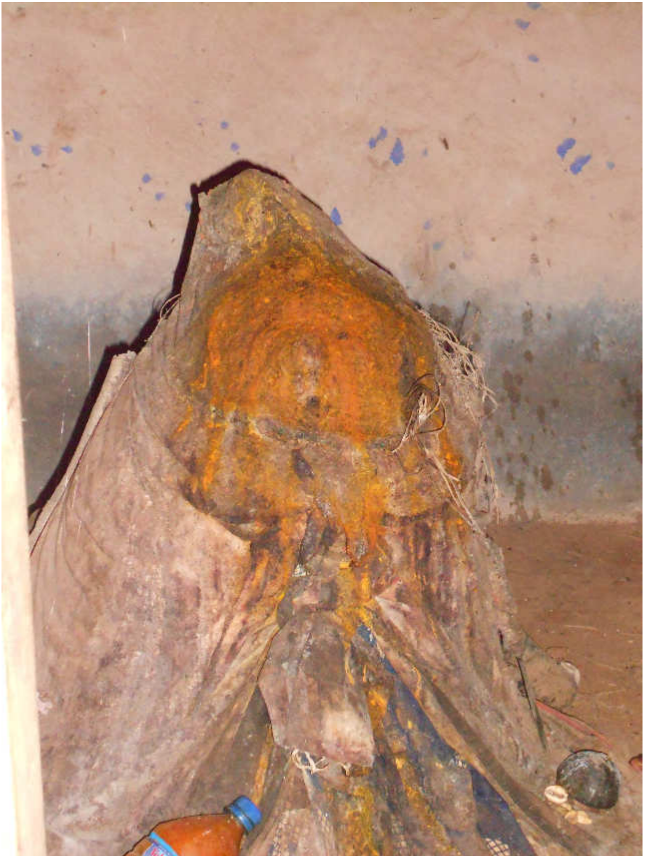
Fig.13-Rappresentazione di un Loa