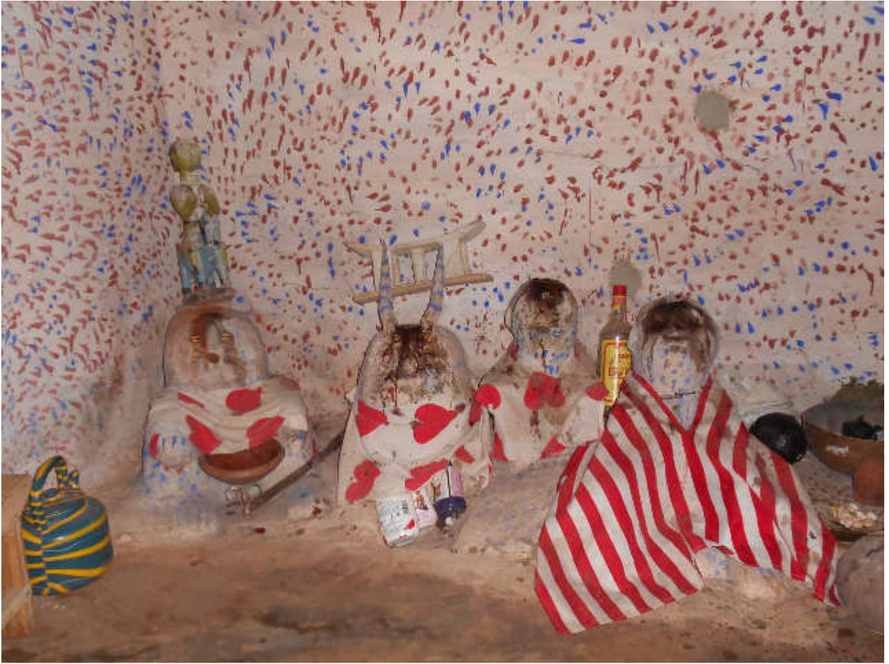
Insieme di Loa