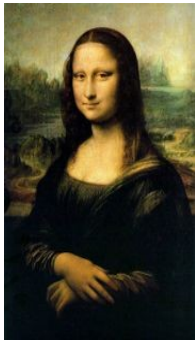
Leonardo, La Gioconda

Il grosso dei dipinti quattrocenteschi è costruito sulla sezione aurea perché si ritenevano essere i rapporti più gradevoli all'uomo; questa idea, che allora era poco più che percepita, acquisterà maggior consapevolezza nel Rinascimento più maturo. Anche in altri ambiti, come in letteratura o in architettura, si usava largamente la sezione aurea la quale era conosciuta come divina proportione perché considerata quasi la chiave mistica dell'armonia nelle arti e nelle scienze. I pittori più affascinati da questa novità (ripresa dal mondo antico) furono Piero della Francesca, Botticelli e soprattutto Leonardo che, oltre ad incorporarla nella Gioconda e nel Cenacolo , la rende protagonista nell' Uomo Vitruviano dove stabilisce che le proporzioni umane sono perfette quando l'ombelico divide l'uomo in modo aureo. Secoli dopo la scienza moderna proverà metodicamente la teoria: ci sono rapporti che conferiscono all'uomo maggior piacevolezza di altri.