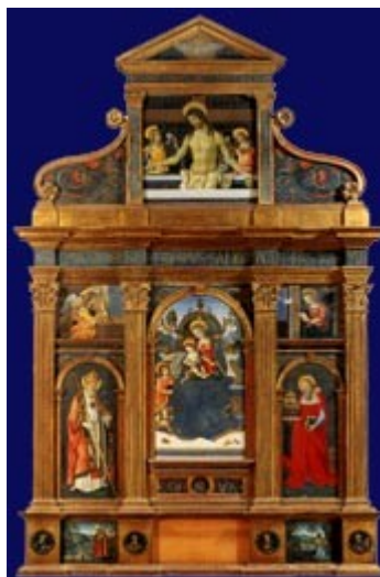
Pinturicchio, Santa Maria degli Angeli (o dei Fossi)

Il Polittico di Santa Maria degli Angeli o dei Fossi del Pinturicchio, conservato nella Galleria Nazionale dell'Umbria a Perugia, ha una sofisticatissima struttura profonda dominata dalla figura geometrica del triangolo. Sovrapponendo tutti i triangoli, ascendenti e discendenti, che sottintendono l'opera si ottiene un poligono stellare al cui centro, inscritta in un rombo, si trova la Madonna.